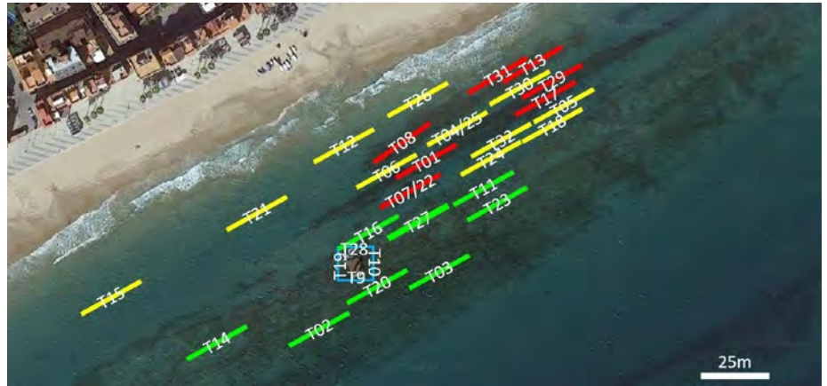
↑ Figura 1. Àrea d'estudi amb els transectes realitzats a cada habitat. Groc: fons de sorra; vermell: roquetes; verd: antina; blau: bloc Alfa i Omega.

Tot i que l'objectiu del treball era mostrar la ictiodiversitat de la platja de Torredembarra, espero que s'hagi pogut veure que ben a prop nostre trobem ecosistemes molt diversos, rics i bonics, i que és important cuidar-los i protegir-los perquè en un futur perdurin i evolucionin. També crec que és molt important donar-los a conèixer perquè la gent se'n conscienciï